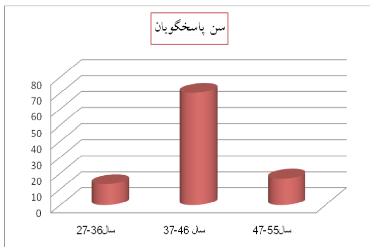
نمودار. توزیع سنی معلمان پاسخ‌دهنده به پرسش‌نامه پژوهش

۵۱ درصد از پاسخگویان این طرح را مردان و ۴۹ درصد را زنان تشکیل داده‌اند. همچنین توزیع سنی معلمان پاسخ‌دهنده به پرسش‌نامه پژوهش در نمودار نشان داده شده است.