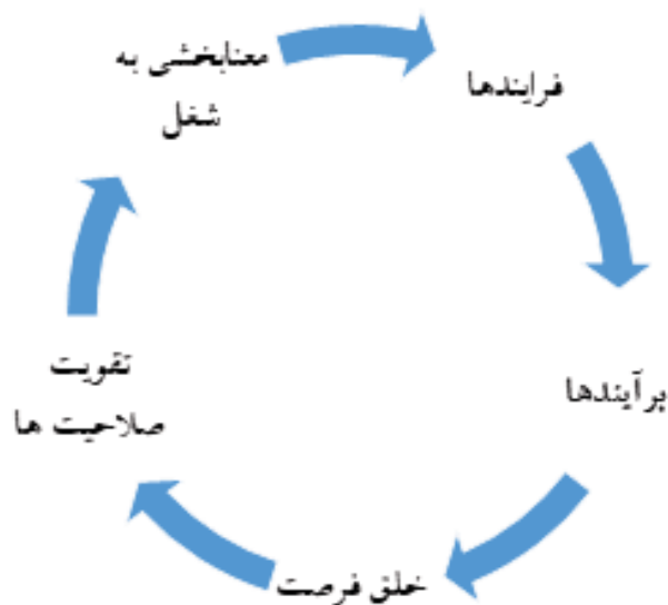
زنجیره لایه‌های انسجام‌بخشی و جاری‌سازی رویکردهای نظام ارزیابی

در نهایت، بر اساس یافته‌های به دست آمده عامل هدف‌مداری دانشگاه، چهارمین عامل مرتبط با فرهنگ ارزیابی در دانشگاه شناسایی شد. در این عامل، به ترتیب مؤلفه‌هایی نظیر: شرح دقیق شغل سازمان برای تمام همکاران اداری و آموزشی، روشن بودن اهداف و رسالت دانشگاه فرهنگیان، استفاده از نتایج ارزیابی در راستای انجام بهتر امور و شکل‌گیری ساختاری مشخص و مدون، در حوزه ارزیابی جای گرفته‌اند.