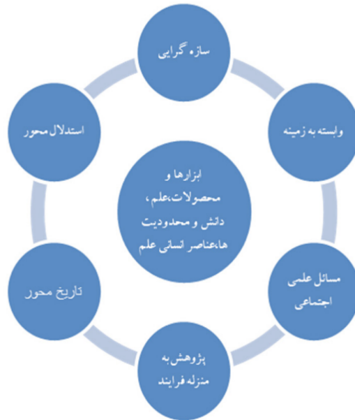
شکل ۱: تلفیق الگوی Dahlin et al, (2009) و Mc comas et al, (2020)

در موضعی قرار گیرند که بتوانند اظهارات مختلف را در قالب گزاره‌ها و اشکال مختلف منطقی قرار دهند و از منظر میزان اعتبار منطقی، به ارزیابی آنها پردازند. از نظر Sisondo (2004) دانشمندان و نیز مهندسان همواره در جایگاهی هستند که باید همکارانشان و دیگران را نسبت به ارزش و اعتبار باورهایشان اقناع کنند.