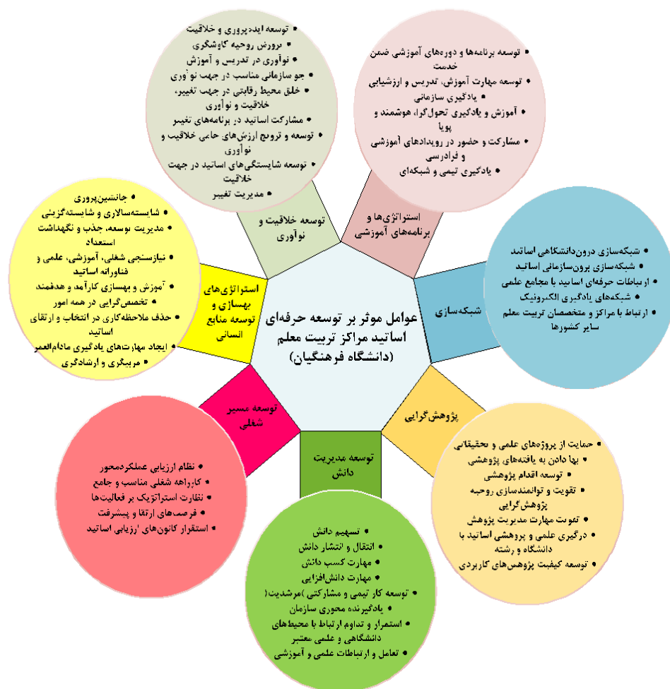
شکل ۳: نمودار گرافیکی عوامل مؤثر بر توسعه حرفه‌ای اعضای هیئت علمی دانشگاه فرهنگیان

سپس در قسمت کمی و به روش تحلیل عاملی تأییدی، اعتبار مدل طراحی شده مورد تحلیل قرار گرفت. لذا روایی سازه که برای بررسی دقت و اهمیت نشانگرهای انتخاب شده برای اندازه‌گیری سازه‌ها، انجام شد نشان داد که نشانگرهای متغیرهای پژوهش، ساختارهای عاملی مناسبی را جهت اندازه‌گیری ابعاد مورد مطالعه در مدل پژوهش فراهم می‌آوردند. بنابراین با توجه به برازش مناسب مدل و نتایج بدست آمده از نتایج کیفی و کمی پژوهش مدل نهایی شده طور شماتیک در شکل زیر مشاهده می‌شود.