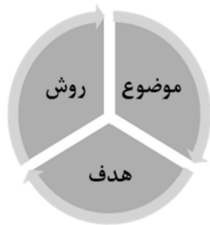
شکل ۳. سه‌گانه موضوع، هدف و روش در تحقیقات

این سؤال‌ها بیانگر لزوم ایجاد ارتباط موثر بین اهداف و روش‌ها هستند که در صورت ناهمخوانی، نه تنها نتایج تحقیق از صحت ساقط خواهند شد، بلکه به زمینه شکل‌گیری و تشدید سوءبرداشت‌ها، تصمیم‌گیری‌های ناروا و عملکرد غیراثربخش دامن می‌زند.