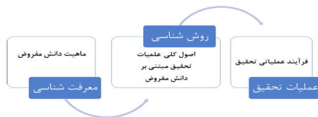
شکل ۲؛ تبیین نقش روش در تحقیقات

منطق حاکم بر تحقیق را به محقق معرفی می‌کند (Lather, 1992)، و محقق با پیش فرض‌های روش‌شناختی حاکم، به انتخاب طرح تحقیق ۱ و نوعی از روش تحقیق از میان روش‌های تحقیق می‌پردازد. در این معنا روش‌شناسی خطوط کلی ۲ حاکم بر روش‌های تحقیق را فراهم می‌کند و روش‌های تحقیق ابزارها و نحوه گردآوری داده‌ها را برای ما فراهم می‌آورند (Howell, 2013) نزول ساحت اعلای معرفت‌شناختی در مقام فلسفی به ساخت عمل، رهیافتی است که روش‌شناسی به صورت بنیادین برای ما به همراه می‌آورد، در این میان روش‌شناسی نقشی واسط ۳ را بازی می‌کند که به اختصار می‌توان در شکل ۲ مشاهده نمود.