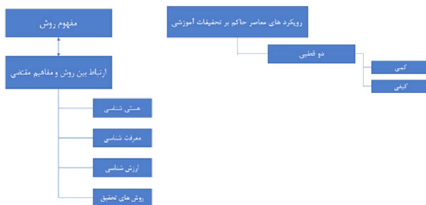
شکل ۱- الف

آن در بین دیگر پیش‌فرض‌های حاکم بر تحقیق، مفاهیم بنیادنی که معمولاً تعریف و تبیین آنها با غفلت مواجه می‌شود را با بیان اهمیت و کارکردشان بازپردازی کرده و سپس با ترسیم محل نزاع کلی در مکاتب متفاوت جایگاه قطبیت‌های حاکم بر تحقیقات آموزشی را بواسطه تبیین گرایش‌های افراطی و ویژگی‌های بارز آن مشخص کند، و بدین واسطه نقشه دو اردوگاه مقابل تحقیقات آموزشی را ترسیم کند، سپس برای تعیین نقطه نظرهای مکاتب متفاوت در روش‌شناسی تحقیقات آموزشی ابتدا با بیان مفاهیم اصلی آنها، نقطه نظرهای هر کدام را مشخص کند، سپس به صورت کوتاه روند تاریخی شکل‌گیری هر کدام و نظریه‌پردازان آنها را معرفی کرده و هر رویکرد را به صورت مختصر در سه سطح هستی‌شناسی، معرفت‌شناسی و روش‌شناسی تشریح کند، سپس تاثیر هر کدام از رویکردها در تحقیقات آموزشی که ذیل آنها صورت می‌پذیرد بیان شده است. در ادامه با بررسی چگونگی تاثیر پیش‌فرض‌های موجود هر کدام از رویکردها بر تحقیقات آموزشی الزامات روش‌شناختی آن را بیان کرده و با واکاوی لایه‌های نهان موثر آنها بر تحقیقات جاری حوزه آموزش، شرایط لازم برای آگاهی به پیش‌فرض‌های این دیدگاه‌ها در فرآیند عملیاتی تحقیق در مطالعات تربیت معلم را فراهم آورد و بدین‌سان از آشفتگی‌های نظرورزانة کنونی که تحقیق‌های حوزه آموزش بدان مبتلا شده‌اند، بکاهد و بن بست گرایش عملیات‌گرایانه صرف به انجام تحقیقات در یک چارچوب معین بدون در نظر گرفتن پیش‌فرض‌های آن را بگشاید. روند کلی فرآیند تحقیق در شکل ۱ نمایش داده شده است.